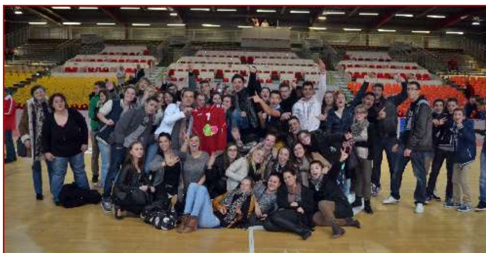
Club le plus dynamique