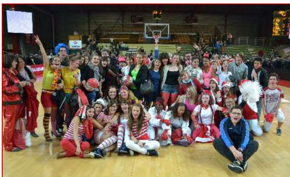
Vainqueur du challenge et la maison familiale la plus colorée