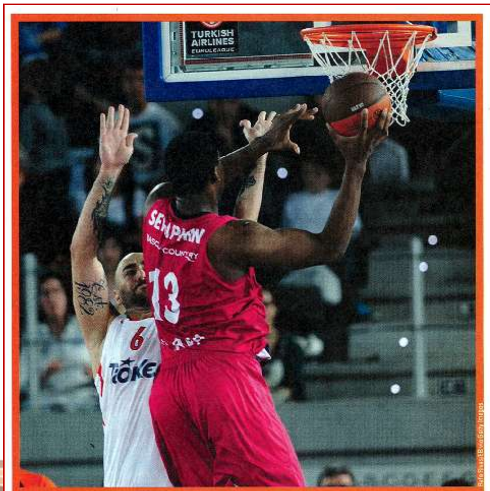
Basket News – Jeudi 10 novembre 2011