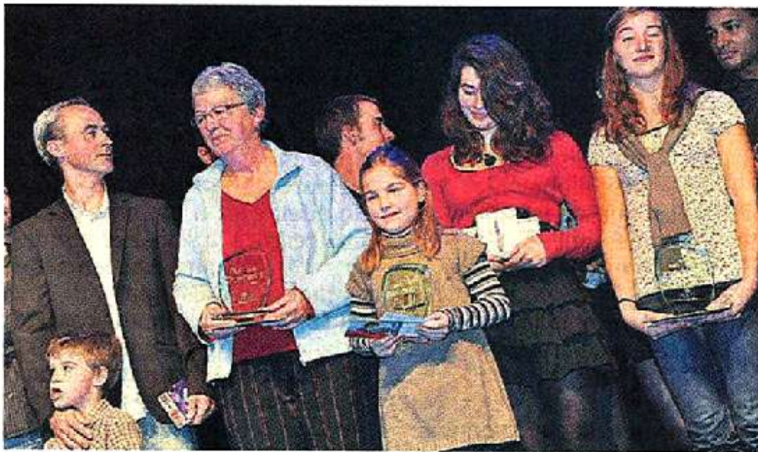
Les trophées ont récompensé des sportifs dans de nombreuses disciplines

La Nuit des trophées a récompensé vendredi à Glisséo les meilleurs sportifs de l'année. Pour certains, la valeur n'a pas attendu le nombre des années. De nombreux clubs et sportifs ont reçu des récompenses pour leurs performances de l'année écoulée. Un coup de projecteur sur certaines disciplines peu connues.