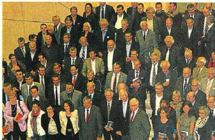
Une partie des « têtes des Pays de la Loire », lors de la présentation de l'ouvrage, jeudi soir dernier.