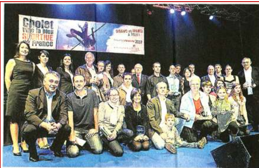
Cholet. Les sportifs à l'honneur. Vendredi soir, la ville a récompensé les clubs et compétiteurs qui ont marqué l'année. Une « Nuit des trophées » qui a vu la natation, les arts martiaux, le badminton, l'équitation et le cyclisme mis à l'honneur, au travers des responsables et pratiquants. Ici, la photo souvenir réunissant les récompensés et les élus.