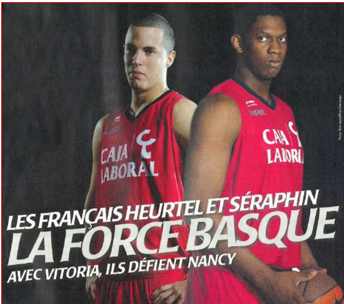
Basket News – Jeudi 10 novembre 2011