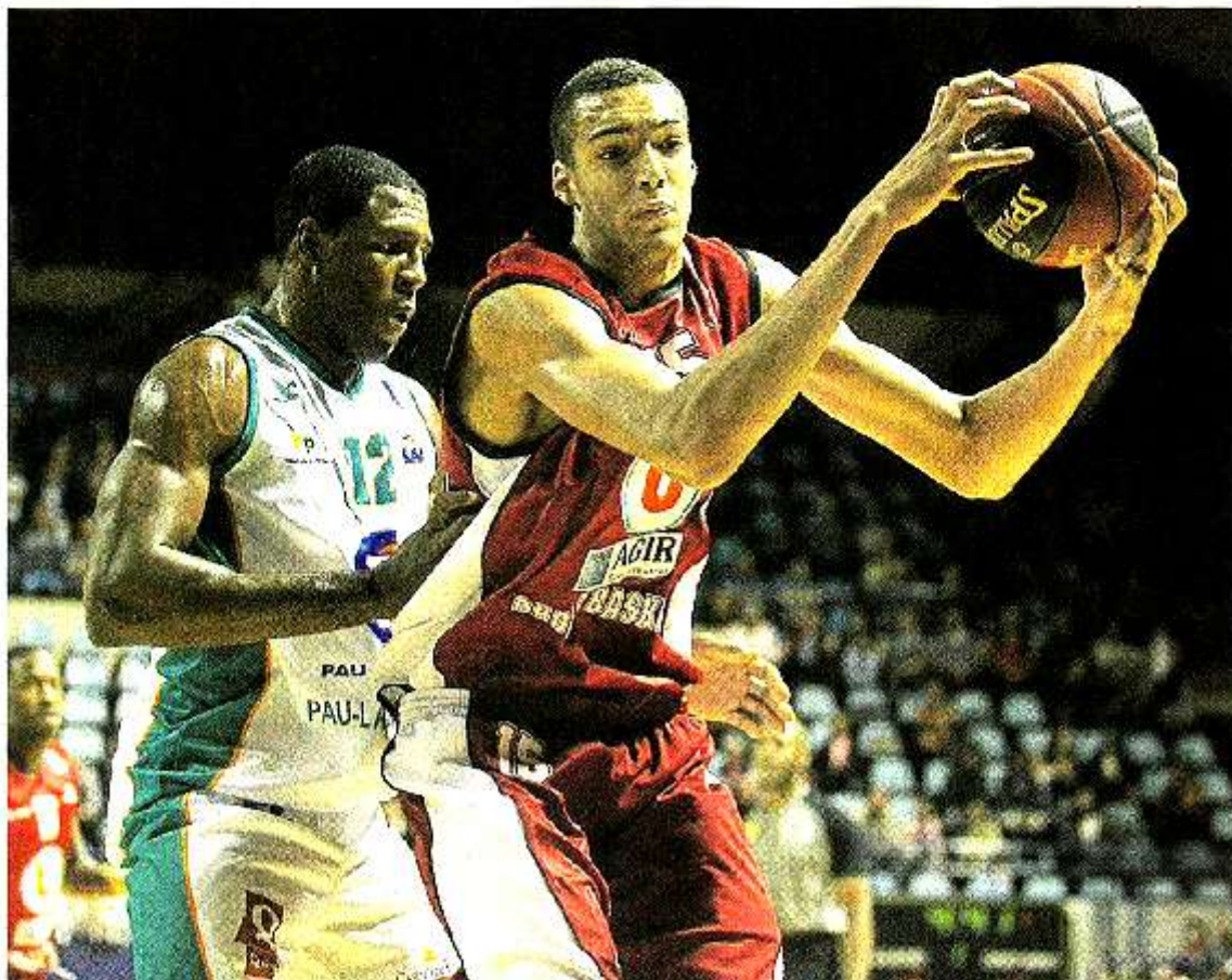
Rudy Gobert était pour la première fois de sa carrière titulaire sous les couleurs du Cholet Basket.