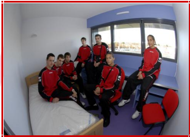
Les jeunes du Centre de Formation dans l'un de leur nouvel appartement