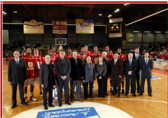
Photo des Maires avec l'équipe pro.

Petit retour en images sur cette soirée :