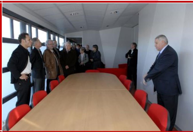
La salle de réunion du centre d'hébergement