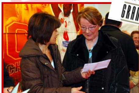
1 repas prestige offert par LE GRAND CAFE