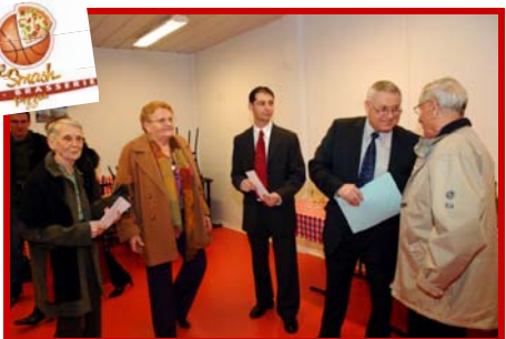
4 pizzas offertes par LE SMASH