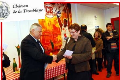
1 repas offert par LE CHATEAU DE LA TREMBLAYE