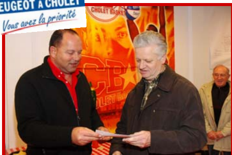
1 semaine et 1 week-end en 407 coupé offerts par PEUGEOT CHOLET