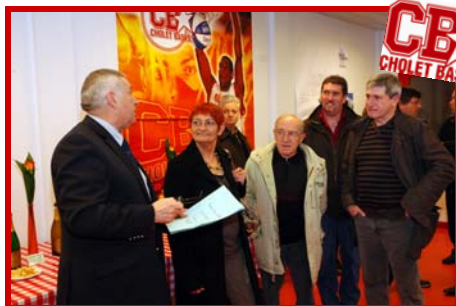
4 soirées VIP offertes par CHOLET BASKET