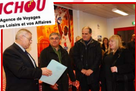
1 voyage à DJERBA offert par RICHOU VOYAGES

RICHOU L'Agence de Voyages pour vos Loisirs et vos Affaires