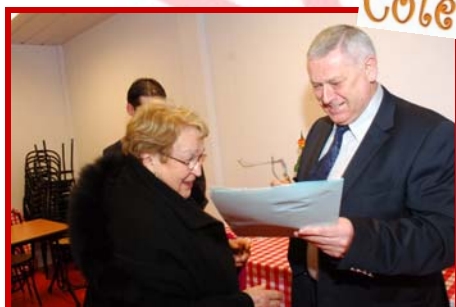
1 chèque cadeau de 40€ offert par COTE COUR