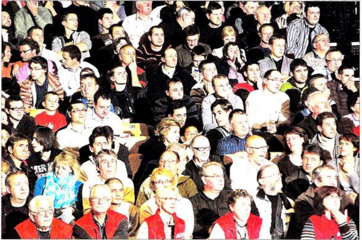
La rencontre de Coupe d'Europe Cholet-Riga était parrainée par « Le Courrier de l'Ouest » qui avait convié de nombreux lecteurs dans les tribunes de CB hier soir

Cholet-Basket a battu Riga par un écart trop faible (75-73), à La Meilleraie hier soir, pour poursuivre son parcours en EuroCup.