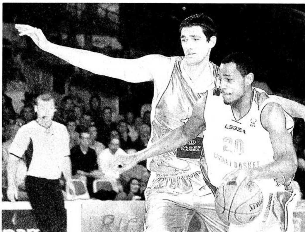
Wiggins et les Choletais ont gagné, hier, mais n'ont pas pu refaire leur retard de sept points de l'aller.

Déloger Riga de la tête des débats semblait alors bien compliqué, mais les alternances choletaises finirent par perturber la défense adverse. A force de tâtonner sur le banc, Cholet mit sur orbite Larrouquis, qui ramena l'équipe des Mauges dans le sillage letton puis aux manettes du match (29-27, 16'). CB faisait mal à distance ? Riga choisit lui de frapper fort depuis l'intérieur. Les 220 cm d'un Sundov très