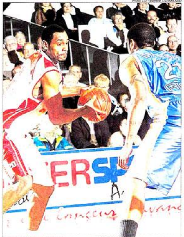
Les joueurs de Cholet-Basket ont creusé un écart trop maigre pour prétendre accéder au second tour de l'EuroCup

Le Courrier de l'Ouest – Mercredi 22 octobre 2008