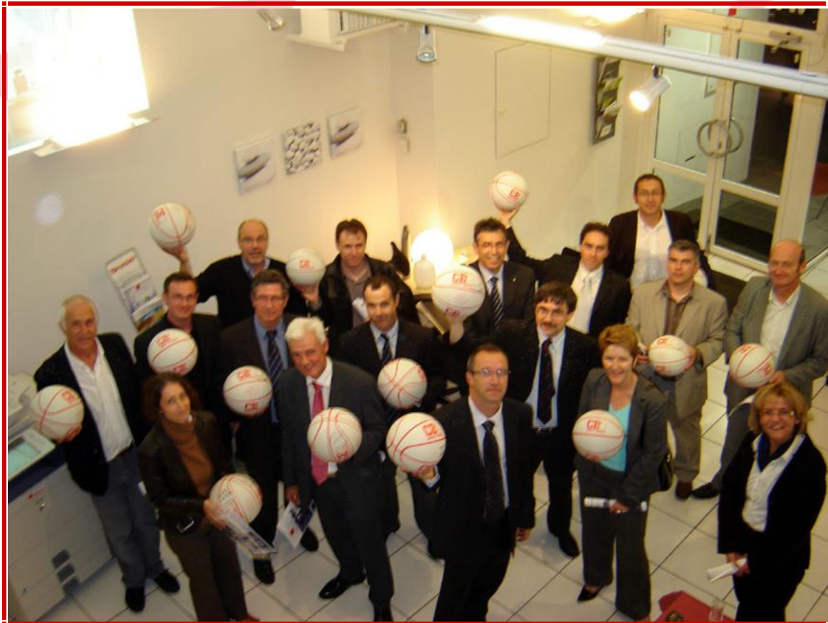
Photo de groupe avec les ballons de Cholet Basket