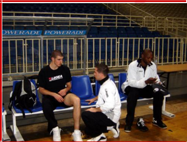
Préparation avant l'entraînement