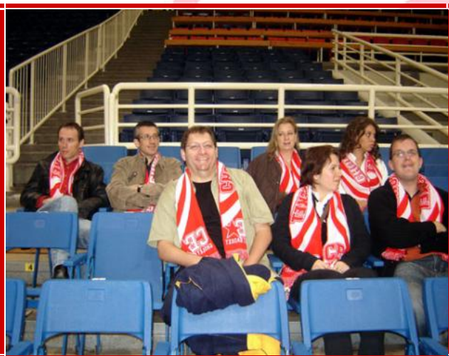
7 fidèles supporters dont 3 partenaires du club présents au match