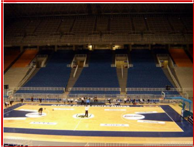
L'Olympic Stadium salle mythique d'environ 19000 places à Athènes