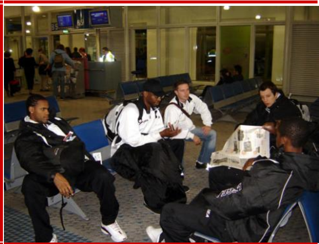
Attente à l'aéroport