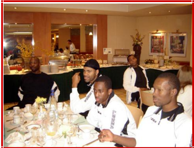
Dîner au Golden Age Hotel