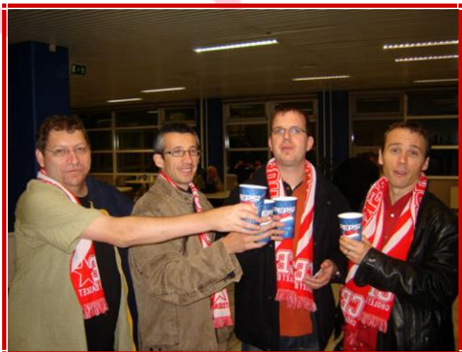
Malgré la défaite, les supporters lèvent leur verre à la bonne prestation choletaise