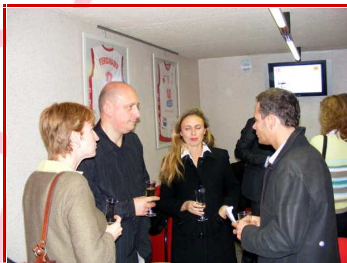
Les invités se sont retrouvés autour du cocktail d'accueil