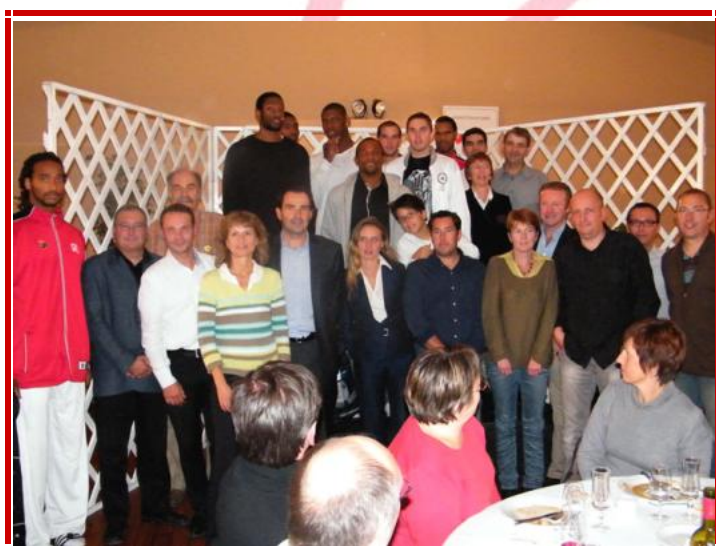
Les joueurs ont posé avec plaisir avec les invités d'AES pour la photo souvenir