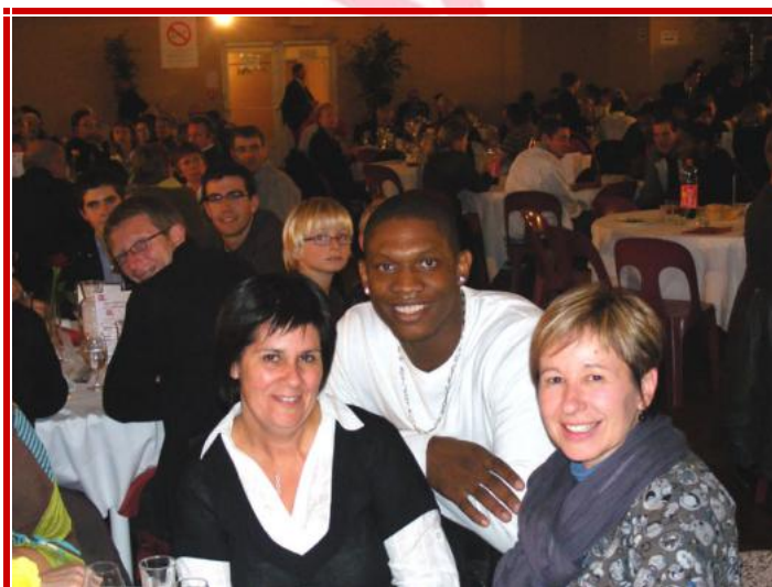
Lors du dîner, les invités des magasins U ont pu rencontrer et échanger quelques mots avec Kevin SERAPHIN