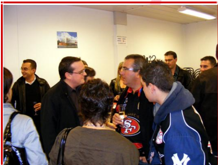
Avant de rejoindre les tribunes, les invités partagent le "verre de l'amitié" et posent pour la photo souvenir