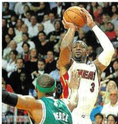
Wade et Miami n'ont pas manqué leurs débuts.

Les Los Angeles Lakers et leur cinq majeur à faire peur ont ouvert la saison de NBA par une vilaine défaite, à domicile, face à Dallas (99-91), pourtant privé de son meilleur joueur, Dirk Nowitzki (blessé au genou). Kobe Bryant, Pau Gasol et tous leurs amis ne sont pas au point collectivement, au contraire de Texans dépannés par leur arrière français Rodrigue Beaubois (11 points, 5 passes décisives en 17 minutes). A Miami, les Heats ont ventilé Boston (120-107), après avoir reçu leur bague de champions en titre, lors d'une cérémonie durant laquelle les joueurs des Celtics sont restés au vestiaire. Dans le dernier match, Cleveland a dominé Washington (94-84).