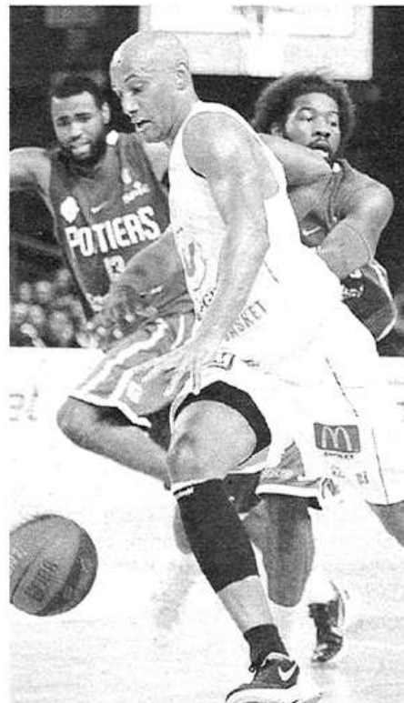
Souchu et les Choletais se sont imposés logiquement face à Poitiers.