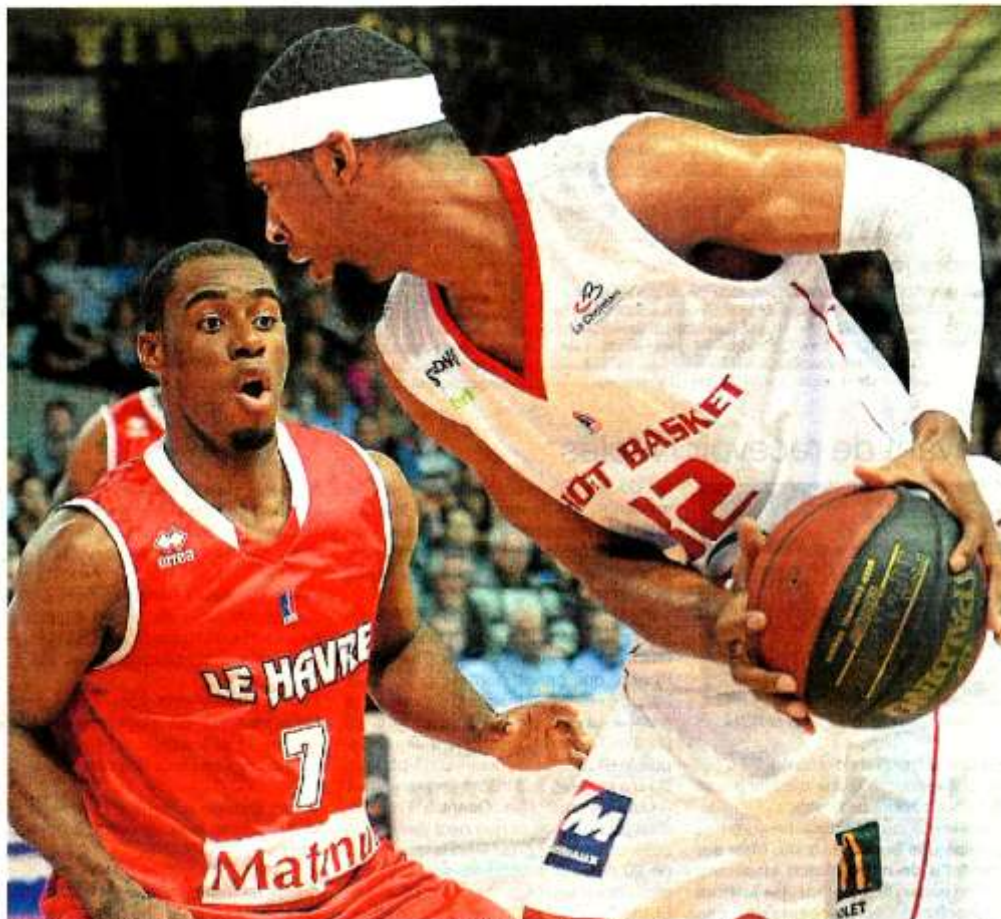
Cholet s'est facilement imposé face au Havre (80-68) et reste en tête de pro A, avec Nanterre.