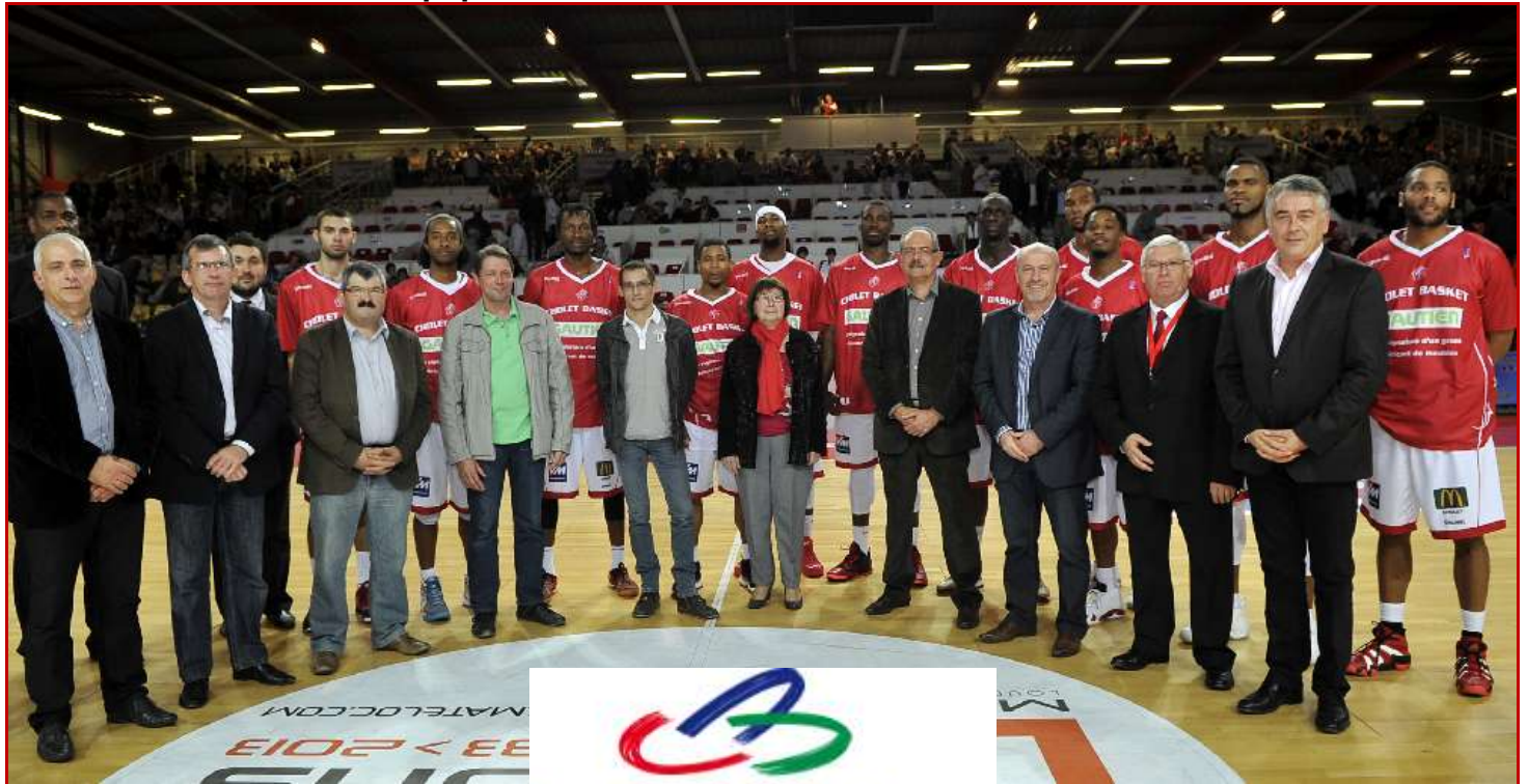
Photo des Maires avec l'équipe Pro