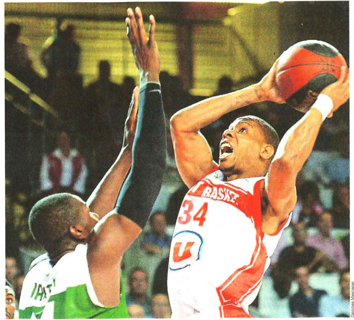
Banks et les Choletais ont fait la course derrière trop rapidement.