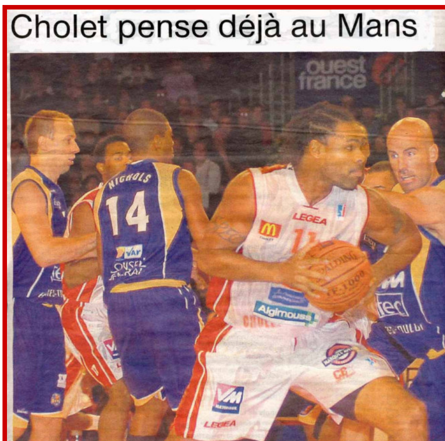
Une du cahier des sports de Ouest-France – Lundi 5 novembre 2007