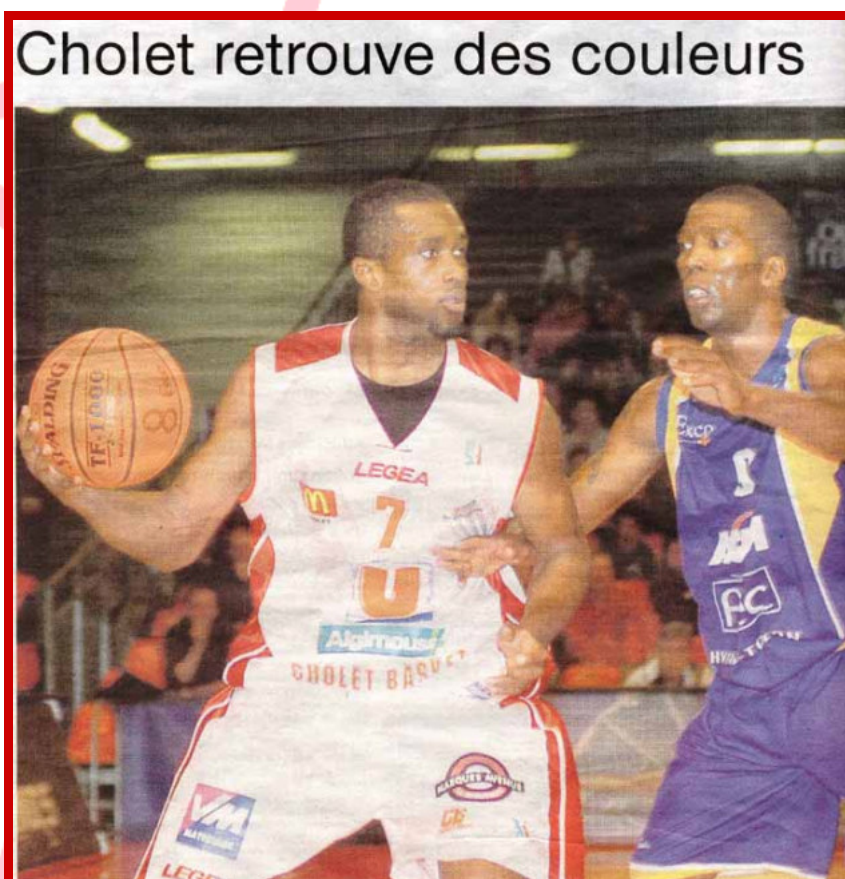
Une du cahier des sports de Ouest France – Dimanche 4 novembre 2007