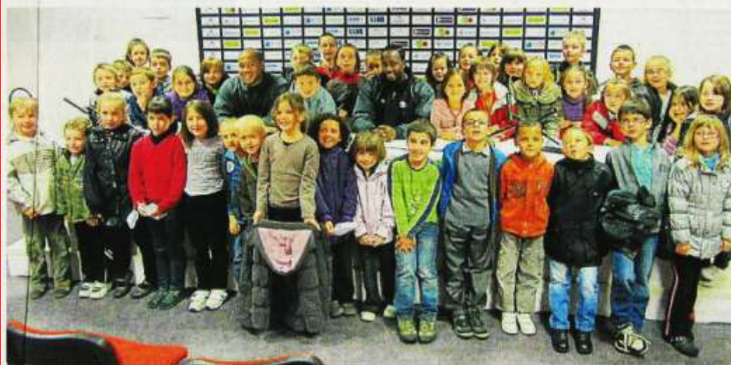
42 élèves de l'école Sainte-Anne ont pu rencontrer les joueurs de Cholet-basket et visiter la Meilleraie.

Les écoliers de Sainte-Anne visitent Cholet-basket