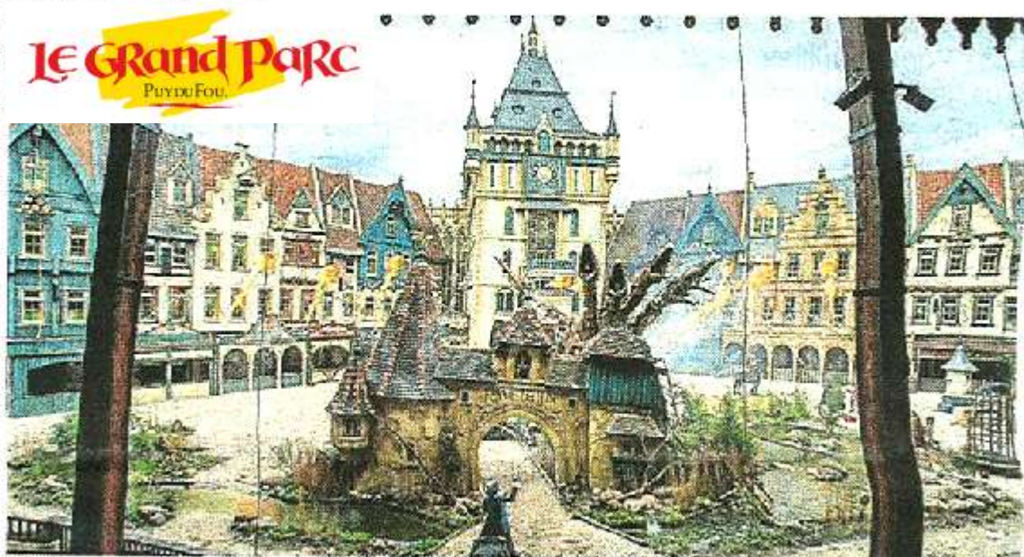
Raveleijn, spectacle créé cette année par le Puy du Fou pour un parc hollandais.

Le parc vendéen, héraut des spectacles vivants chargés d'histoire, est courtisé par des pays qui veulent valoriser leur culture.