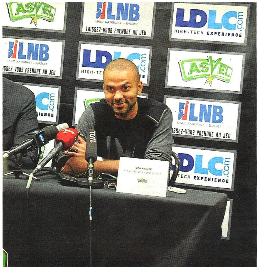
Villeurbanne, Astroballe, samedi. Tony Parker est aussi à l'aise dans son poste de meneur de jeu des Spurs que dans celui de son costume de président de l'ASVEL.