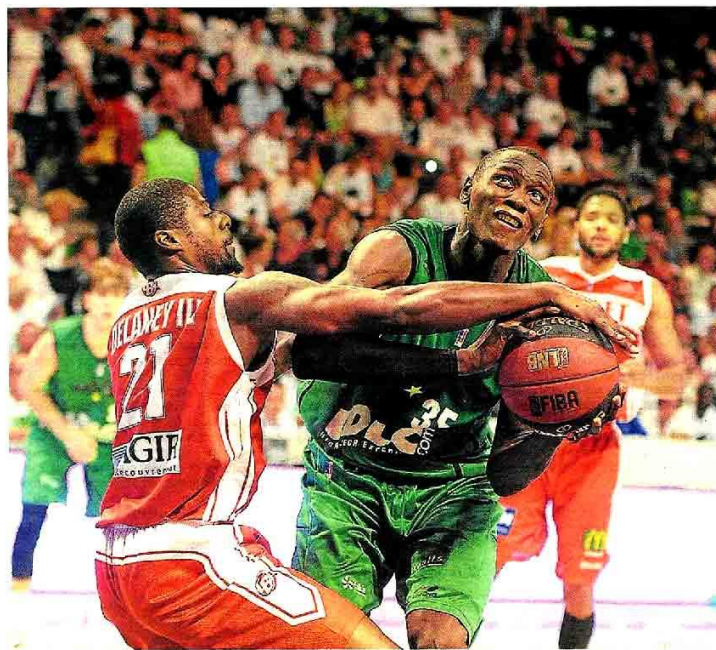
Devant son président Tony Parker, l'ASVEL a dominé des Choletais trop tendres (67-56).