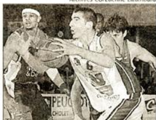
Nando De Colo veut franchir un nouveau palier