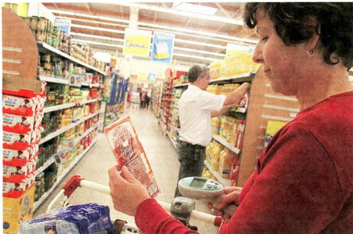
200 clients utilisent aujourd'hui le pistolet électronique proposé par l'HyperU de Chemillé.

A Chemillé, plus besoin de galoper pour gagner du temps. Le client édite sa facture en remplissant son chariot. Pratique.