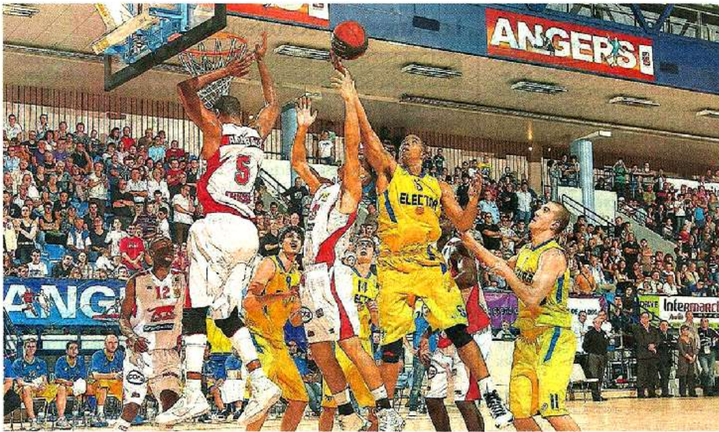
Angers, salle Jean-Bouin, hier soir. Comme en 2009, le Maccabi Tel-Aviv - ici en jaune - a fait main basse sur le Pro Stars, en disposant cette fois-ci du champion de France Nancy au terme d'un match sans suspense.