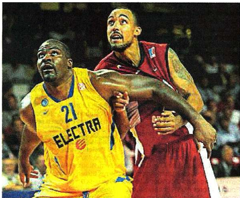
Cholet, La Meilleraie, vendredi. Sofoklis Schortsanitis, alias « Baby Shaq », est l'une des pièces maîtresses - et incontournables ! - du Maccabi Tel-Aviv. A voir ce soir salle Jean-Bouin.

Le champion de France jouera la finale du Pro Stars. Solide sur ses bases défensives, Nancy s'est débarrassé hier de Villeurbanne (79-71). En fin de soirée, les Lorrains croiseront le fer avec les Israéliens du Maccabi Tel-Aviv. Au lendemain de leur cavalier seul face à Cholet (105-74), les vice-champions d'Europe ont été poussés hier dans leurs derniers retranchements par une étonnante