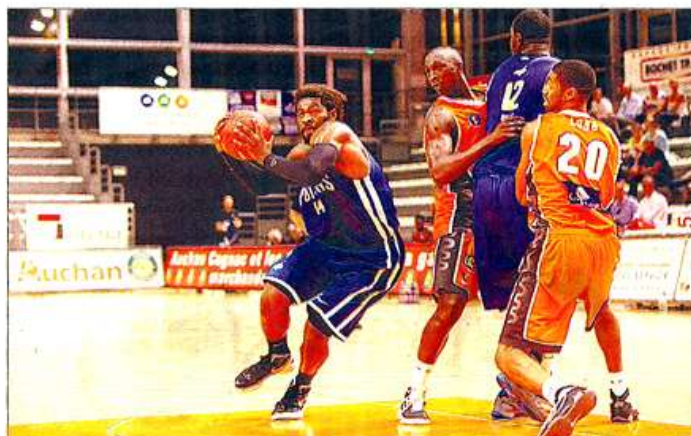
À la pause, Poitiers était mené 35-23 face au Mans Sarthe Basket.