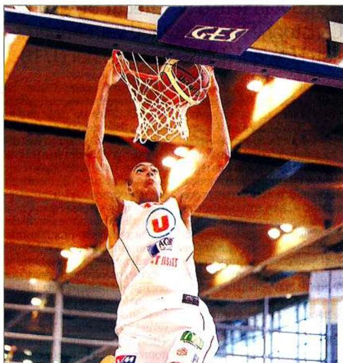
Les Choletais s'en sont donnés à cœur joie en atomisant les JSA Bordeaux (88-71).

À l'heure où nous écrivons ces lignes, la rencontre entre Le Mans et Poitiers est toujours en cours. Vous retrouverez un compte rendu détaillé dans notre édition de lundi.