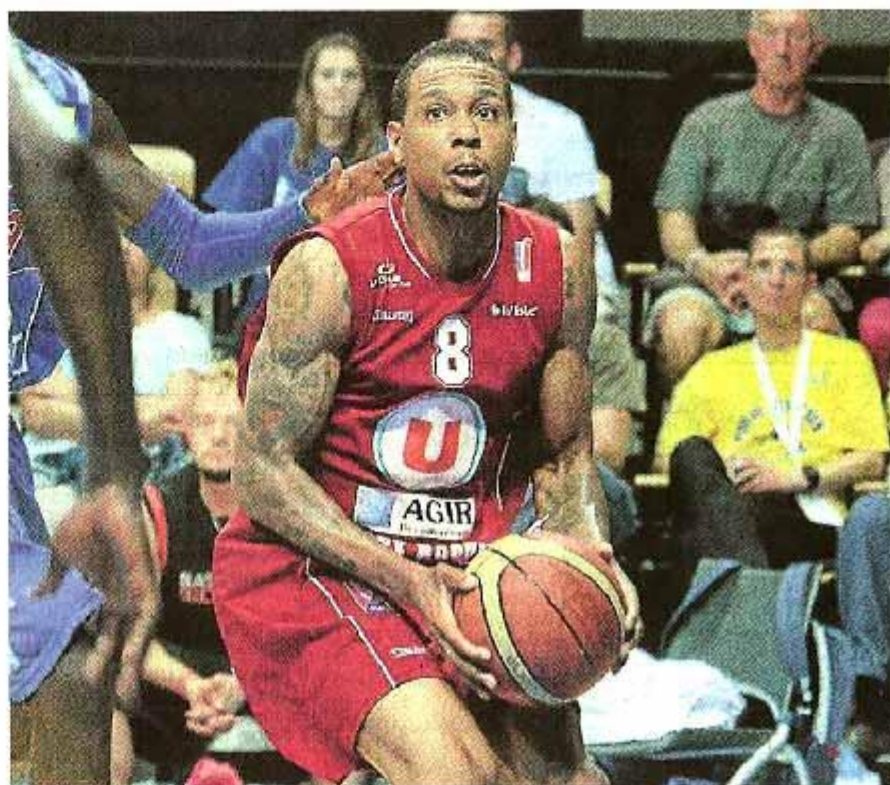
Du haut de ses 32 ans, Banks veut prouver qu'il a encore de beaux restes.

Tant mieux. Car un Banks bien dans sa tête et dans ses baskets se mue facilement en chef de meute.