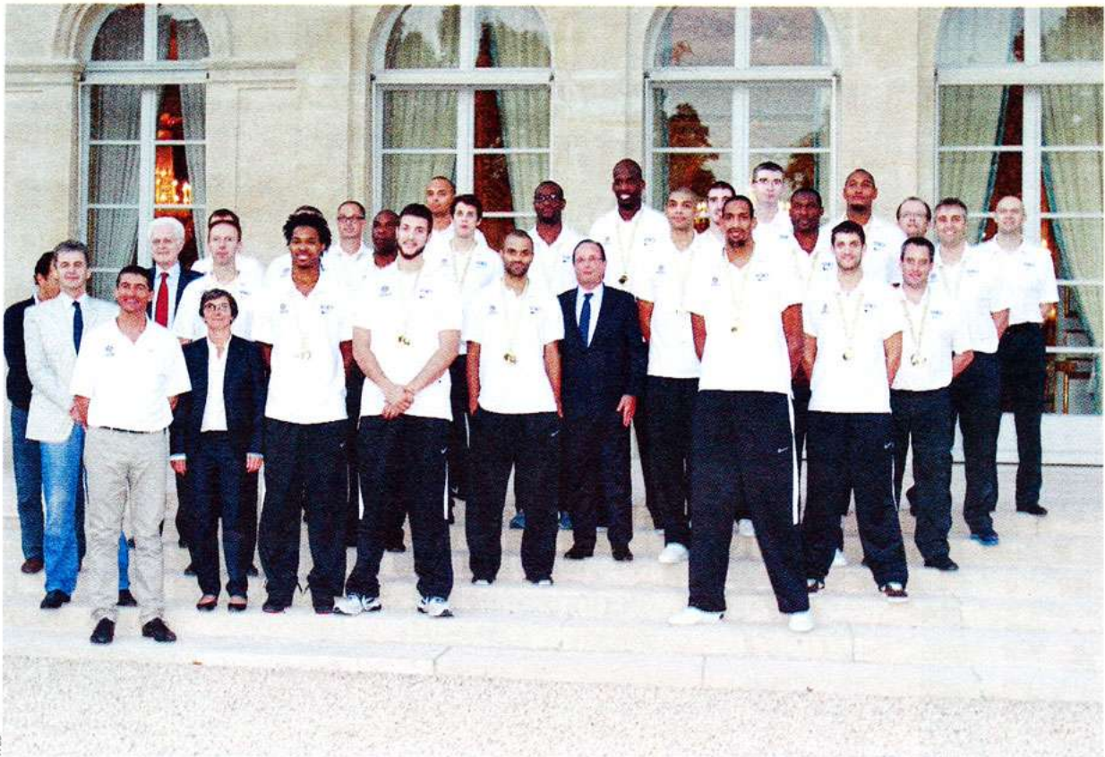
↳ Bousculades à Roissy. Les héros sont de retour.