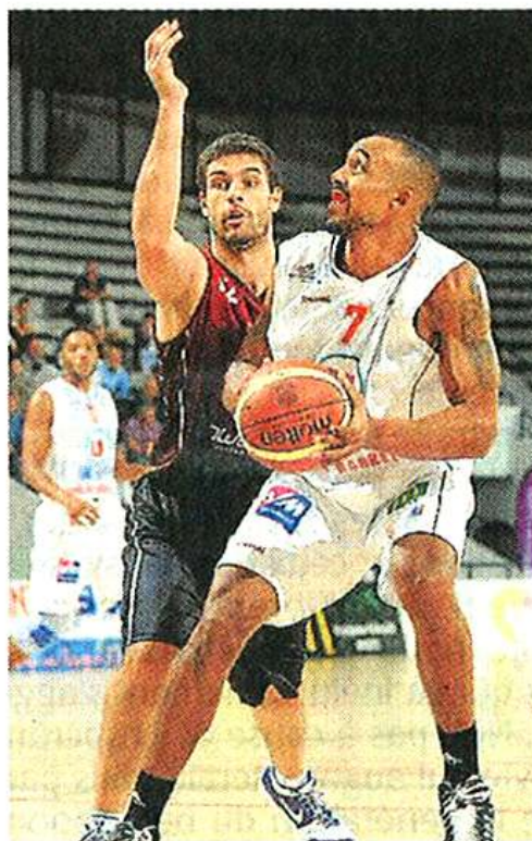
La saison démarre pour les supporters et les joueurs de CB.

Cholet basket invite tous ses abonnés championnat + Coupe d'Europe et Grand Supporter ainsi que les membres des C'Bulls à venir récupérer leurs titres d'abonnement au Smash (3 avenue Marcel-Prat) aux dates suivantes : lundi 23 septembre de 16 heures à 19 heures, jeudi 26 septembre de 16 heures à 19 heures et vendredi 27 septembre à partir de 18 heures à la salle de la Meilleraie. A cette occasion, Cholet Basket remettra une invitation pour la rencontre amicale CB-Le Havre qui se disputera vendredi 27 septembre à 20 h 30 sur le parquet de la Meilleraie.