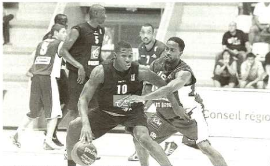
Pamba-Juille et les Orléanais ont dominé la compétition à Vannes.

Trophée du Golfe à Vannes. Orléans a regalé le public, tout en dominant Cholet (84-65). Le Mans a pris le meilleur sur Nanterre pour la 3 e place (83-81).