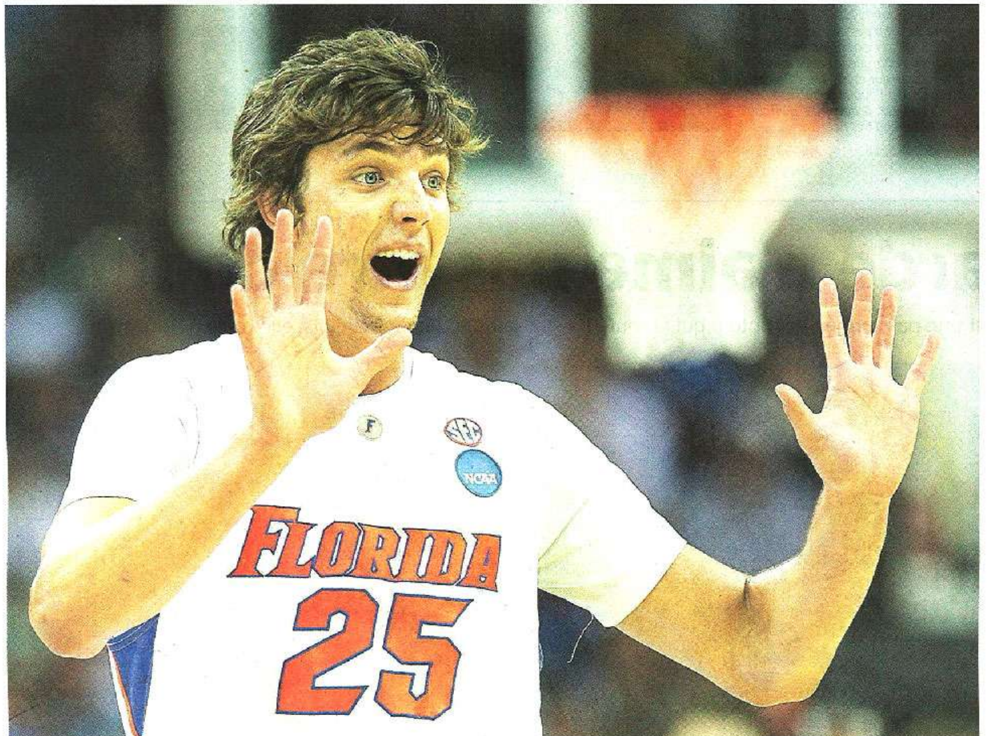
Nouvelle-Orléans (Etats-Unis), 24 mars 2011. Chandler Parsons s'est forgé une solide réputation de joueur polyvalent et adroit sous son maillot des Gators de Floride. En attendant de découvrir la NBA, cet Américain drafté au 38 e rang par Houston portera les couleurs de CB au moins jusqu'au 4 octobre.