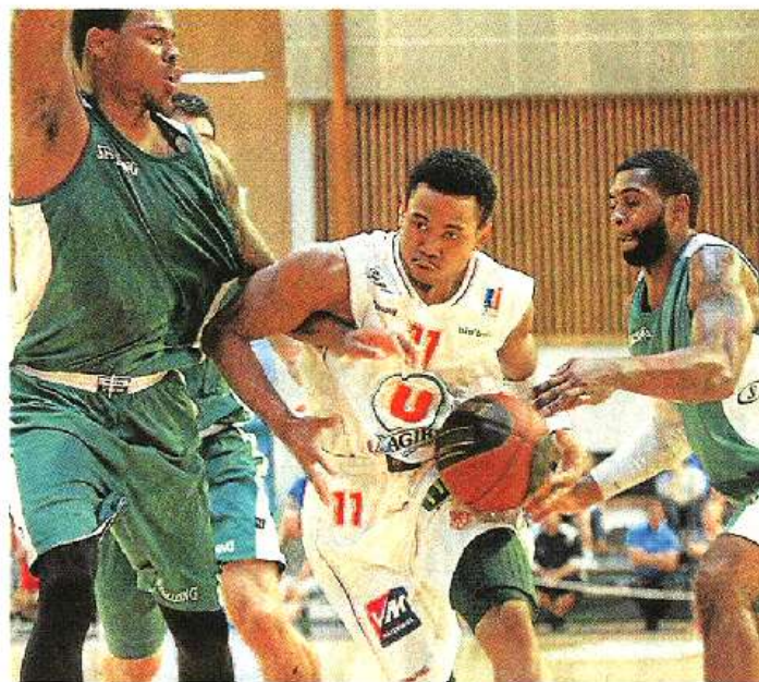
Stoglin a pris ses responsabilités au shoot, éparfois un peu trop souvent peut-être.

Aro-bouté sur une zone d'un bel hermétisme, Cholet enquinqua le champion de France avec une belle constance défensive. Et ses alternances intérieur-extérieur portèrent un temps leurs fruits à l'autre bout du parquet (15-7, 7'). L'intensité