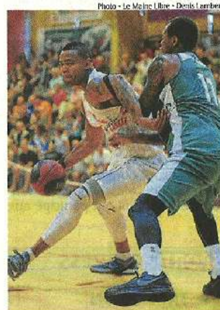
Marquis avec ses 15 points a été le meilleur marqueur choletais.

NANTERRE : 31 paniers réussis sur 63 tentés dont 10/24 à 3 points et 13/17 lancers. 36 rebonds (Leslie 11). 20 passes décisives. 25 fautes personnelles. Les marqueurs : Judilh 11, Lisch 12, Meacham 10, Corosline 11, Thomas 15, Leslie 15, Daniels 7.