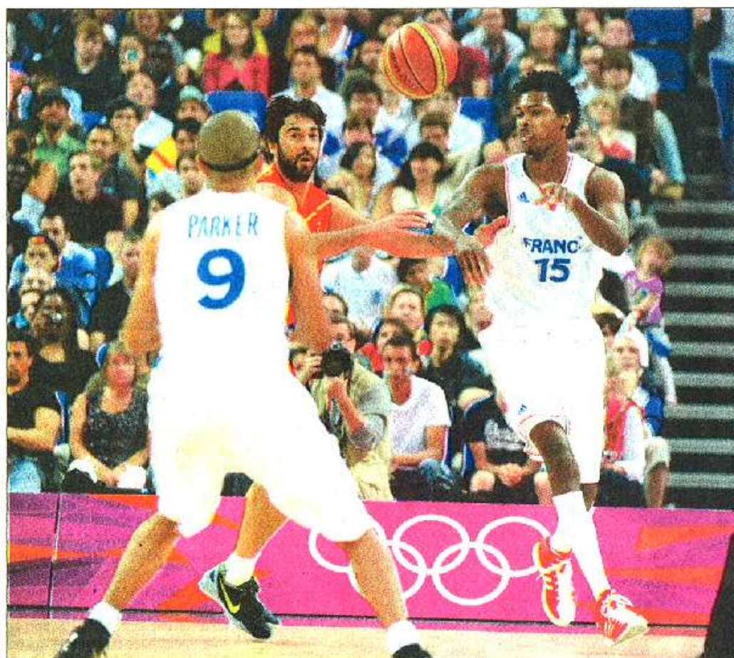
LONDRES, NORTH GREENWICH ARENA, 8 AOÛT 2012. – L'ailier Mickaël Gelabale (15) passe la balle à Tony Parker devant l'Espagnol Juan Carlos Navarro lors du quart de finale des Jeux Olympiques.