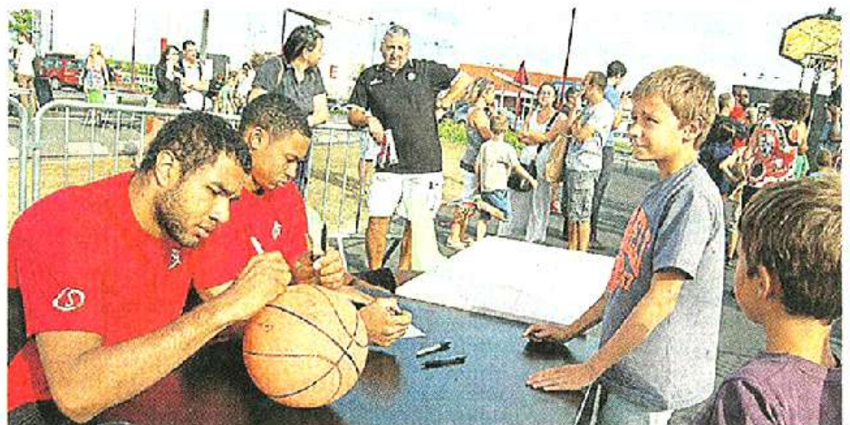
Les joueurs se sont livrés à une séance de dédicaces à l'Autre Faubourg hier.

Les « rouge et blanc » de Cholet affronteront Orléans en match amical ce week-end à Vannes pour le Trophée du Golfe. Leur premier match à La Meilleraie, ce sera le 6 octobre contre Dijon.