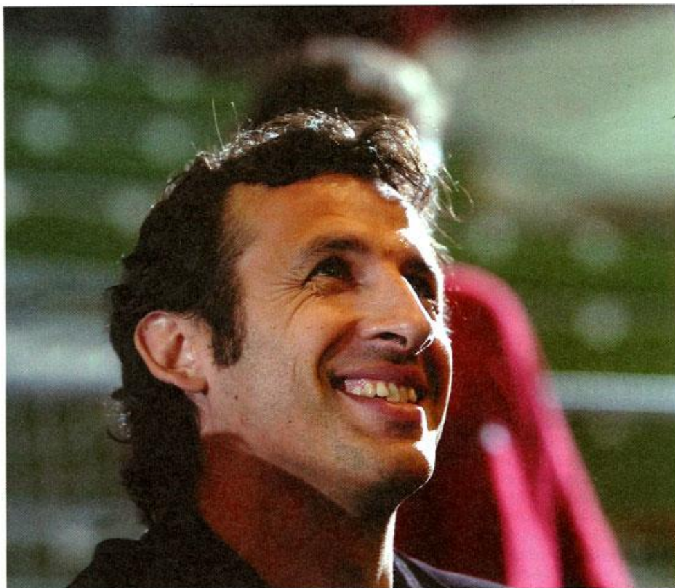
Fred Amez / HIT SPORTS

C'est gentil de le dire ou de le penser (rires) mais aujourd'hui je suis à l'étranger et pour le moment je n'ai pas eu cette occasion. Probablement d'ailleurs que je n'ai pas tout fait pour mais ce n'est pas pour cela que j'en vis plus mal. Et il n'y a pas d'actualité pour le moment là-dessus, de mon côté.