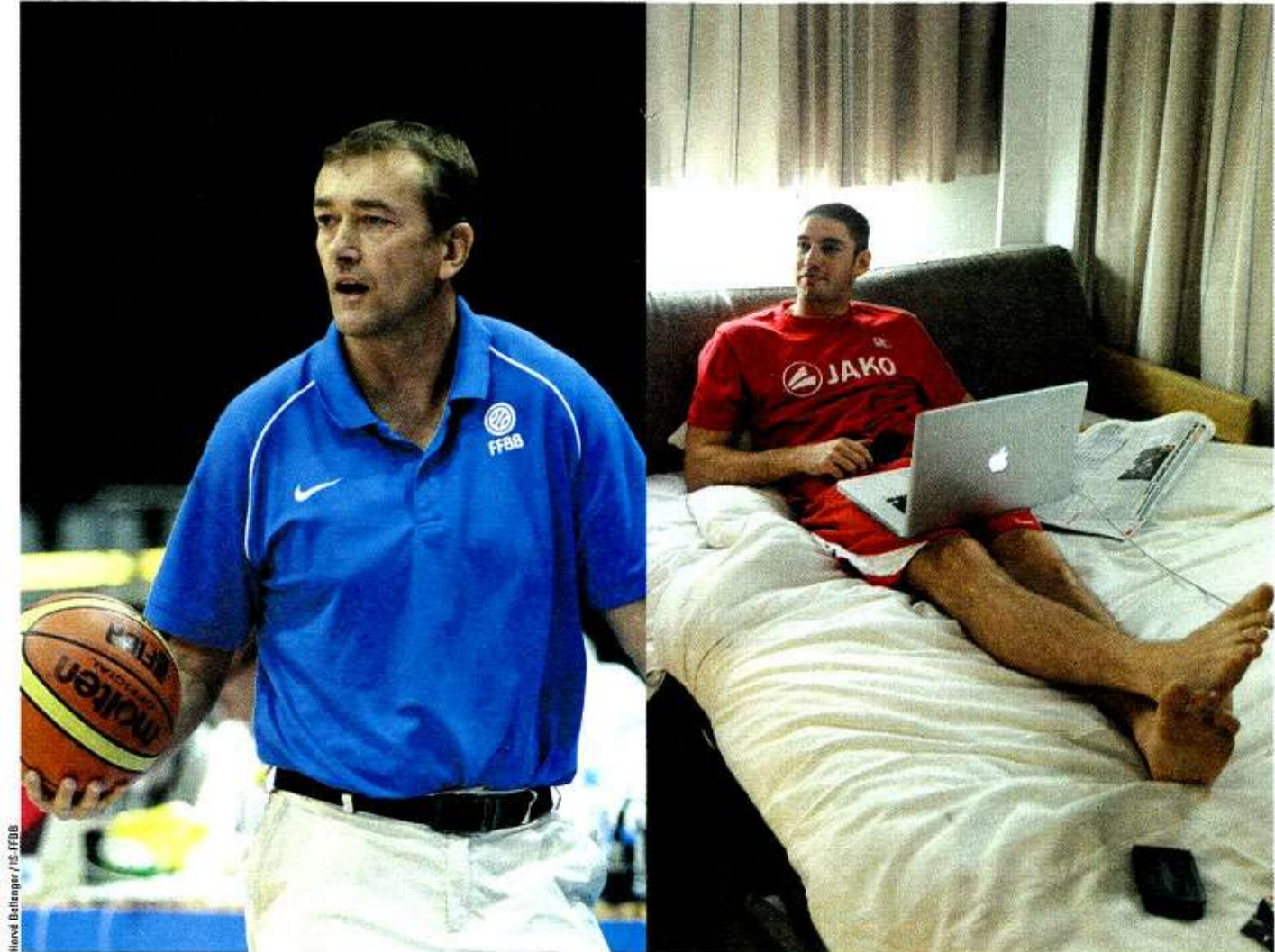
Hové Bollinger / IS-FFBB