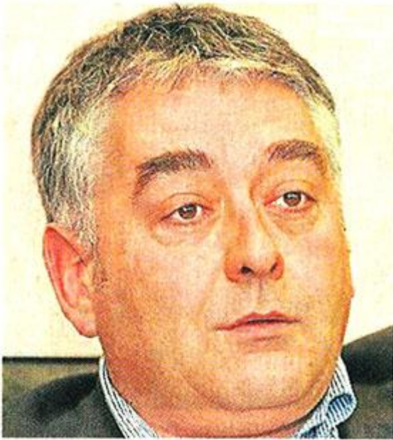
Gilles Bourdouleix , président de la communauté d'agglomération du Choletais (Cac), député-maire de Cholet.

« Mon cas est facile : je suis un professionnel de la politique, je vis confortablement de ça. Ma semaine type ? Le lundi est plutôt consacré aux réunions institutionnelles : mairie, Sèvre Loire habitat, communauté d'agglomération, et le soir, réunion de bureaux, du conseil municipal ou de la Cac. Puis c'est deux jours et demi à Paris, du mardi au jeudi.