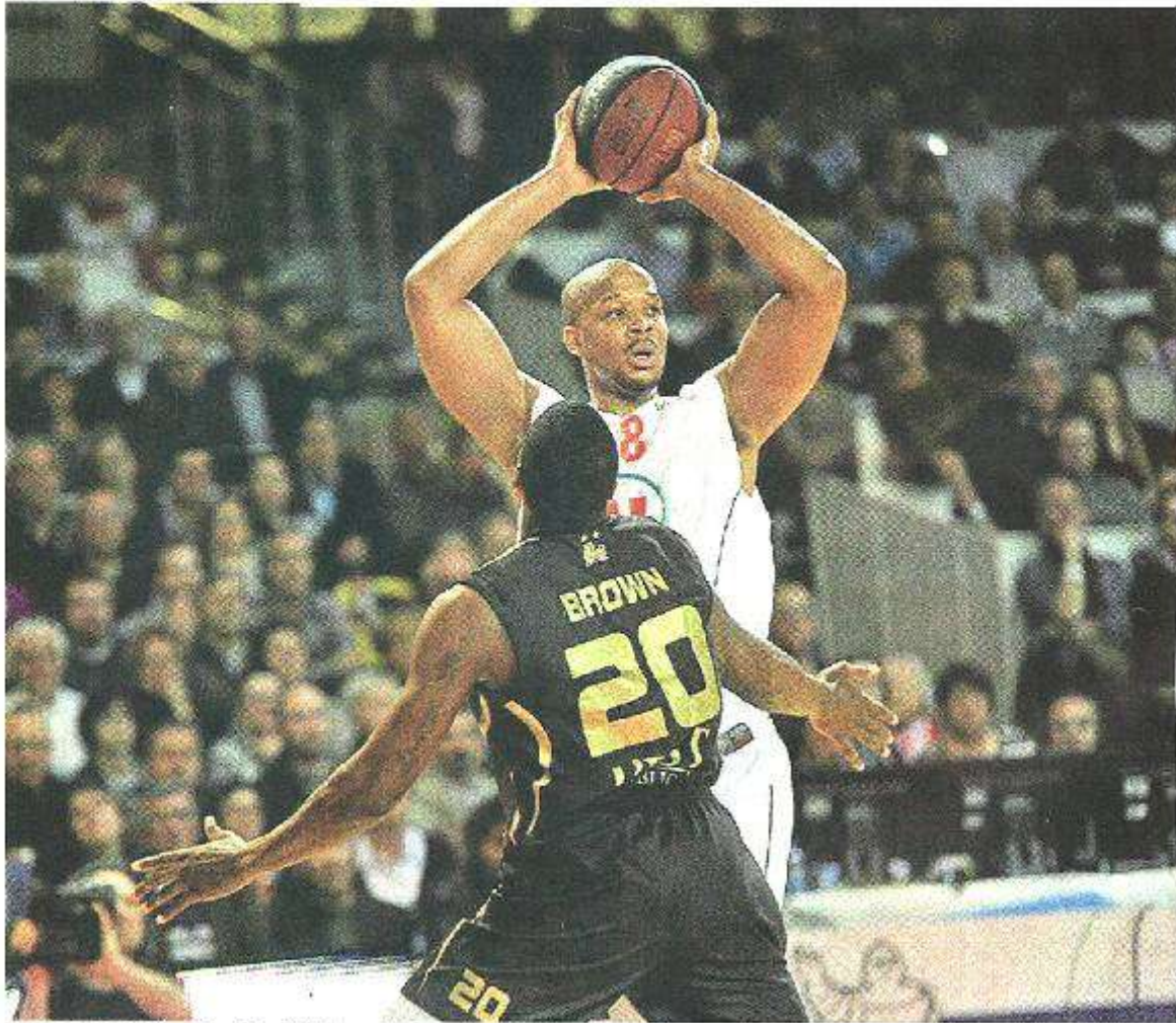
Cholet, La Meilleraie, hier. À l'image de Bryant, les Choletais ont fini par prendre le dessus sur les Nancéiens. C'est une bonne nouvelle dans l'optique du maintien.

Au terme d'un vrai match de la peur en bas de tableau de Pro A, les Choletais ont poussé un grand ouf de soulagement face à Nancy (68-67). Le maintien est quasiment acquis.