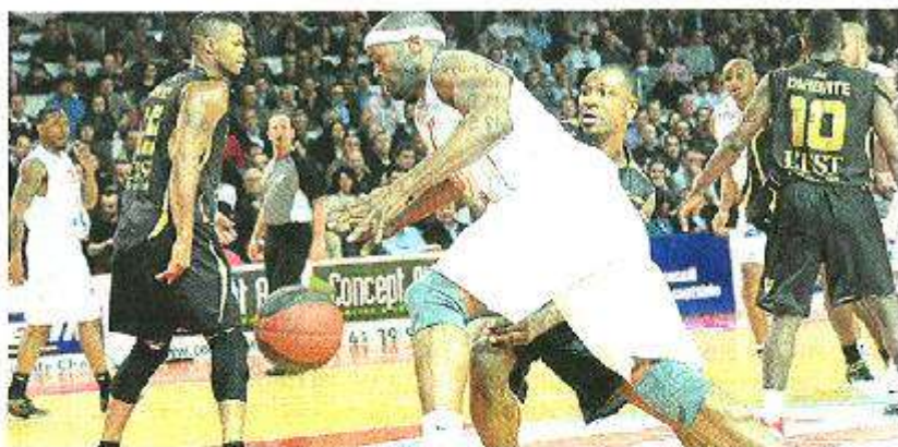
Goree, ici en action, n'a pas pu finir le match.

Le retour sur le parquet de Rudy Gobert, avec un panier, un rebond défensif et un contre en l'espace d'une poignée de secondes, permettait de faire le ménage. Un tir lointain un peu présomptueux d'AJ Slaughter permettait aux Cholet de se