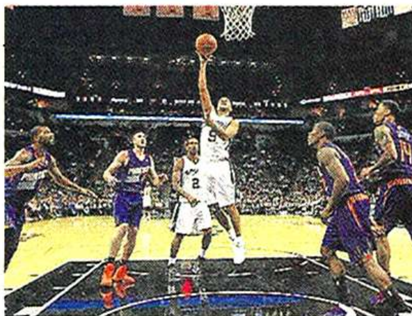
USA Today Sports

98-90. Boston - Utah 97-87 ( Gobert : 0 pt, 1 contre en 5'). Minnesota - Golden State 93-106. Oklahoma - Dallas 107-93.